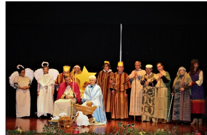
FESTA DE NATAL 10-12-2017