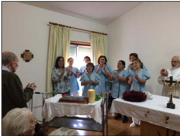
10º ANIVERSÁRIO 15-01-2017