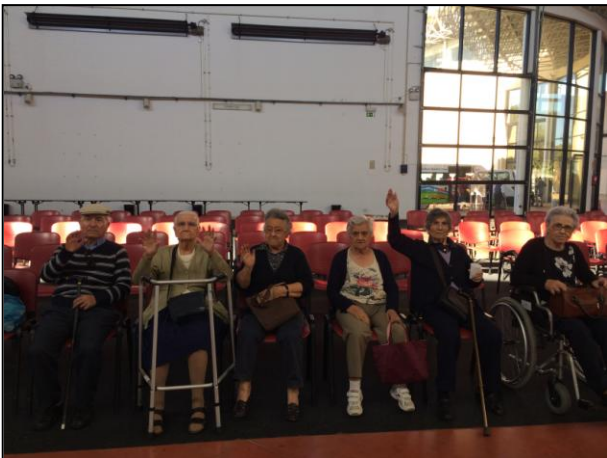
ENCONTRO INTERGERACIONAL 26-07-2017