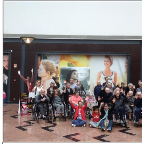
SESSÃO DE CINEMA 30-05-2017