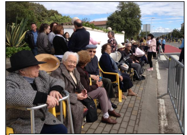
RECEÇÃO AO PAPA FRANCISCO 12-05-2017