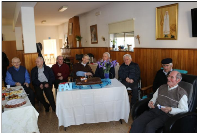
DIA DO PAI 19-03-2017