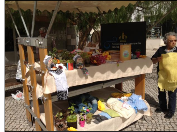
MERCADO SÉNIOR 08-06-2017