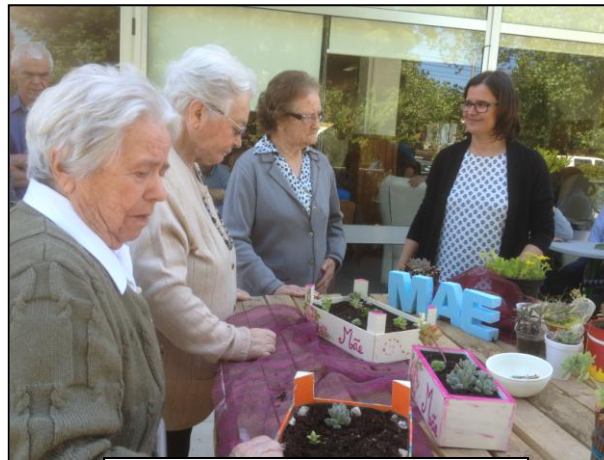
DIA DA MÃE 07-05-2017