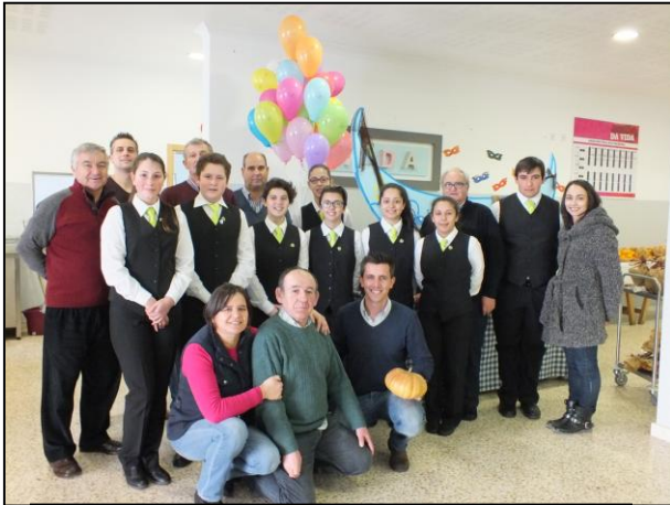
ALMOÇO DAS COMADRES 26-02-2017