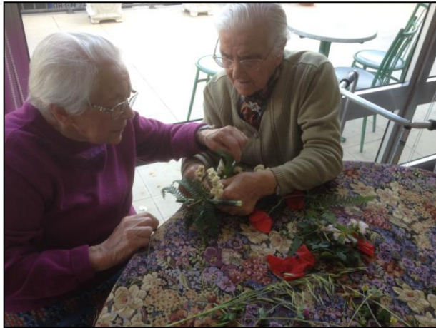
DIA DA BELA CRUZ 03-05-2017