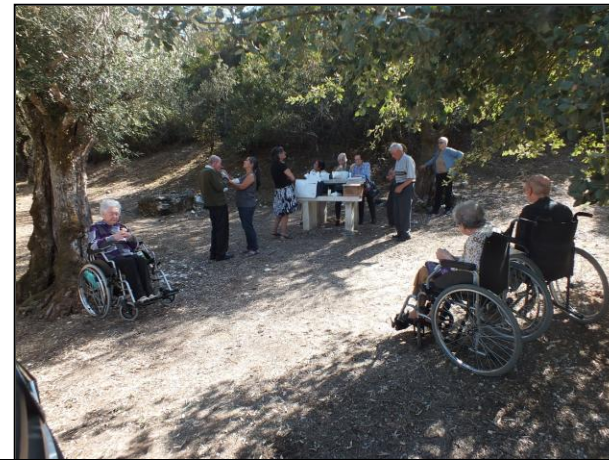
DIA MUNDIAL DO DOENTE DE ALZHEIMER 29-09-2017