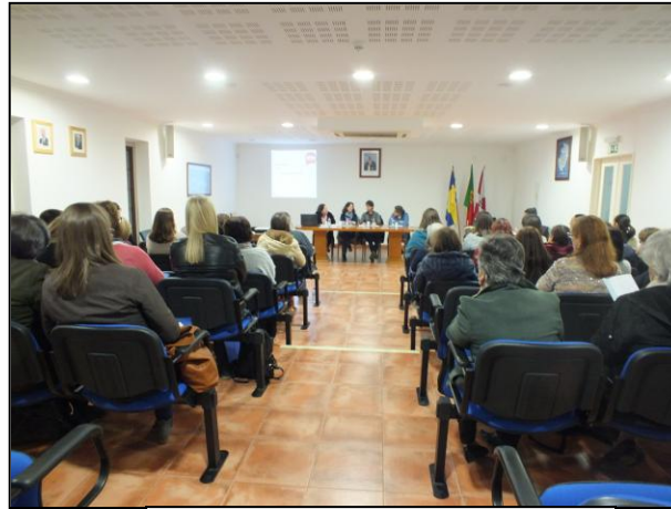
CICLO FORMATIVO 10-2017