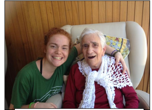
JOVENS VOLUNTÁRIOS CSM 07-06-2017