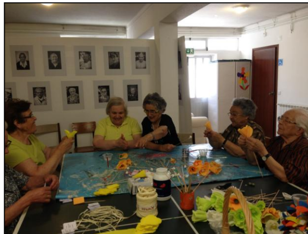
PREPARAÇÃO DE FLORES