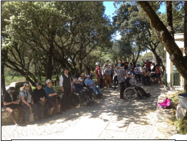
VIA SACRA NOS VALINHOS 11-04-2017