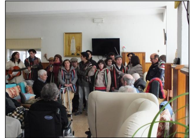
CANTAR A JANEIRAS - CRIF 6-01-2017