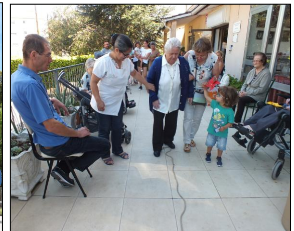
DIA DOS AVÓS 29-07-2017