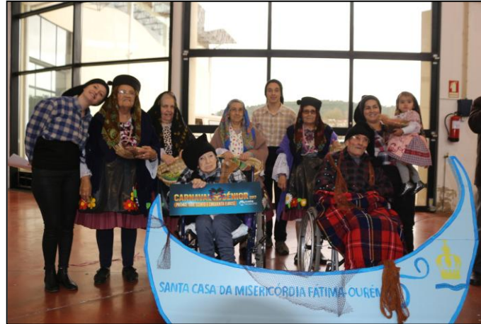
DESFILE DE CARNAVAL EM OURÉM 27-02-2017