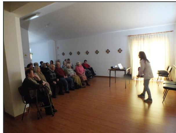
DIA DA SAÚDE 05-04-2017