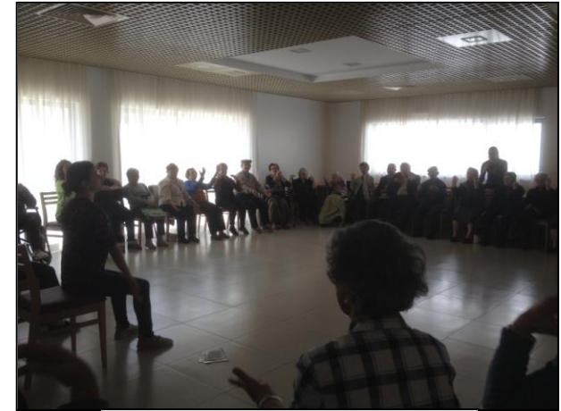
DANÇA SÉNIOR 27-04-2017