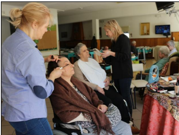
DIA DA MULHER 08-03-2017