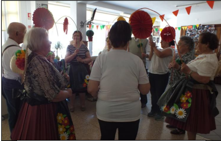
FESTA DOS SANTOS POPULARES 23-06-2017