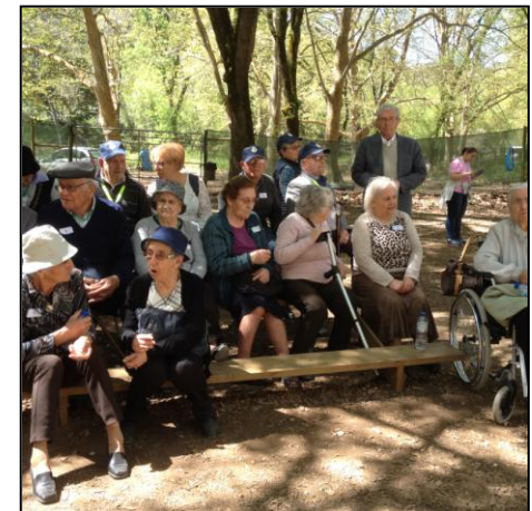
PASSEIO SÉNIOR 07-04-2017