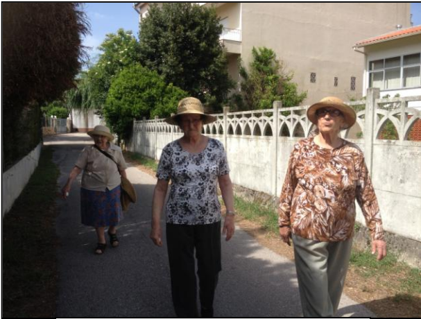
APANHA DA ESPIGA 25-05-2017