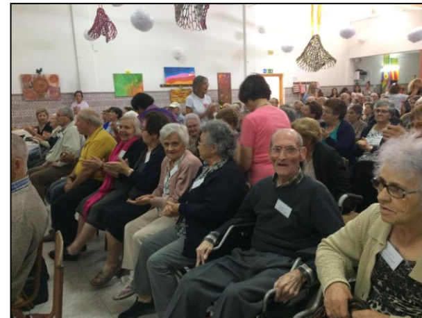
COR E MOVIMENTO + 65 30-09-2017