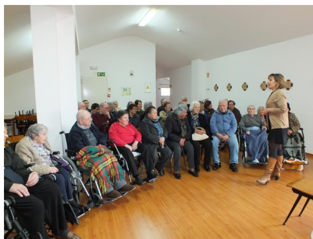
Hora do Conto Bibli. M. Ourém 30-03-2016