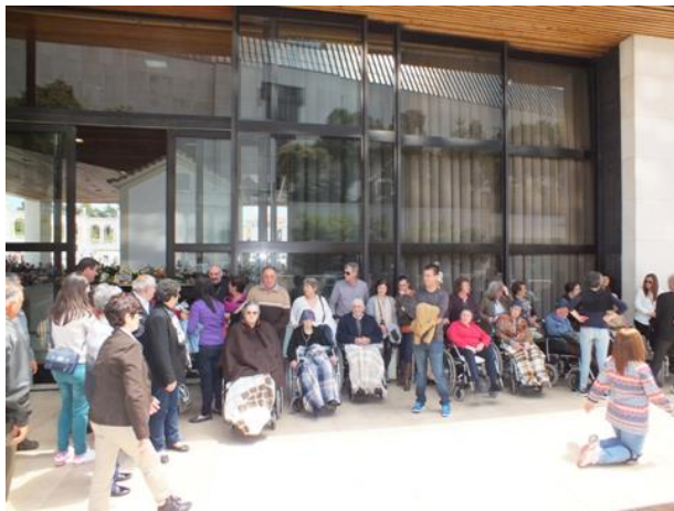
IDA A MARIA + ESPETÁCULO "O dia em que o sol bailou" 15-05-2016