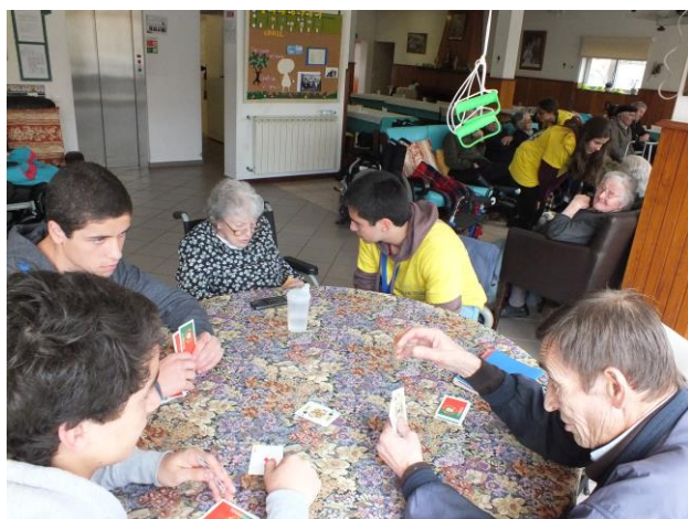
Visita do grupo de Jovens de Nª Sra. 09-04-2016