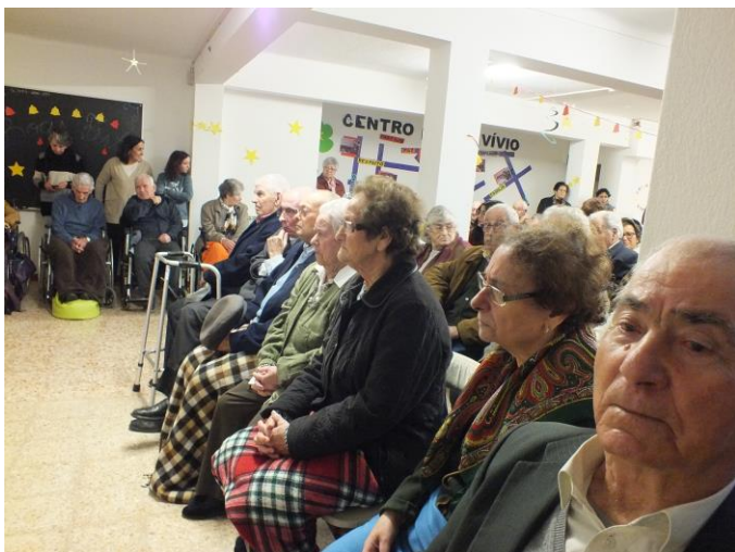
Festa de Natal 04-12-2016