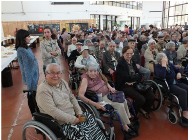
Espectáculo Musical 14-06-2016