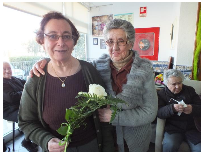
Dia da Mulher 08-03-2016