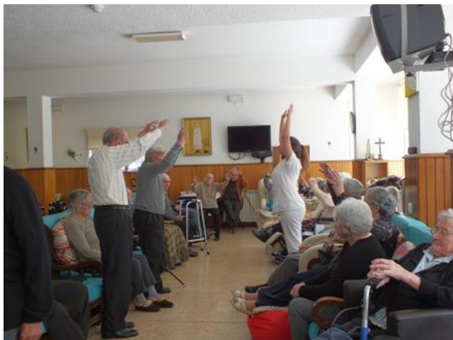
Sessão de movimento 16-06-2016