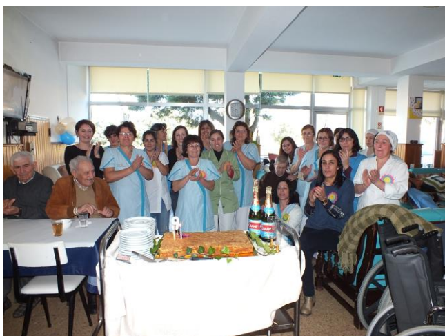
IX Aniversário de abertura do Lar 15-01-2016