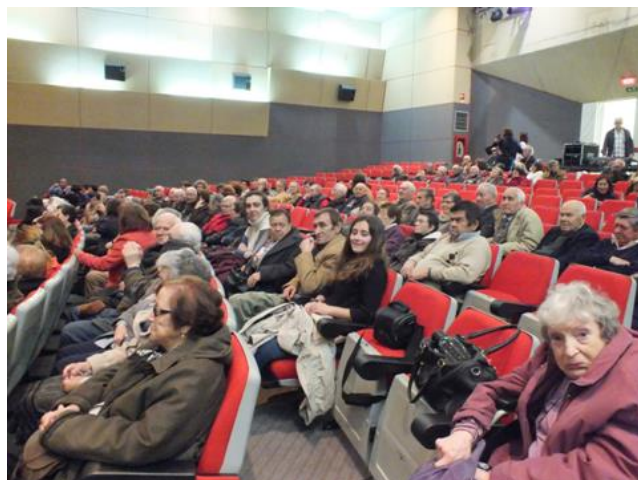
Teatro "Velha é você" 10-05-2016