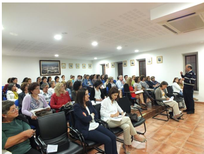
Ciclo Formativo "Eu cuido, Tu cuidas, Ele cuida-me..." 21 de set. a 19 de out. 2016