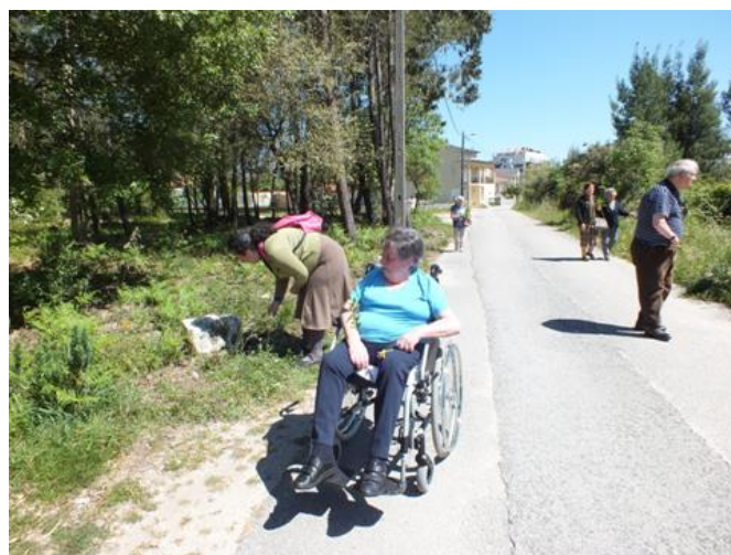
Dia da Bela Cruz 03-05-2016