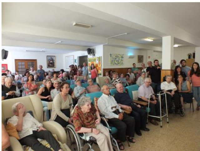
Dia dos Avós 30-07-2016