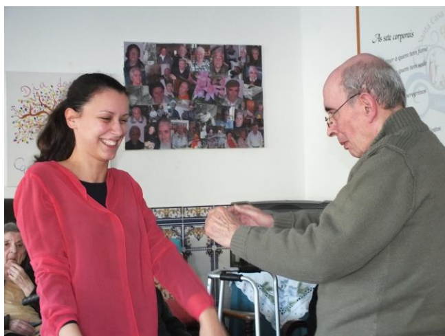
Sessão de riso fev. 2016