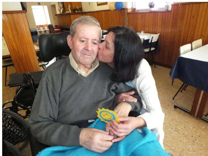
Semana do obrigado 11 a 15-01-2016