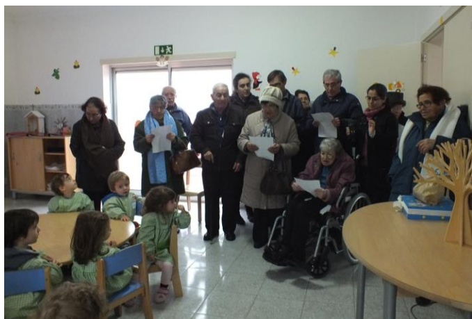
Dia de Reis 06-01-2016