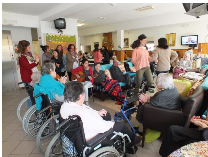
Visita de voluntários 08-02-2016