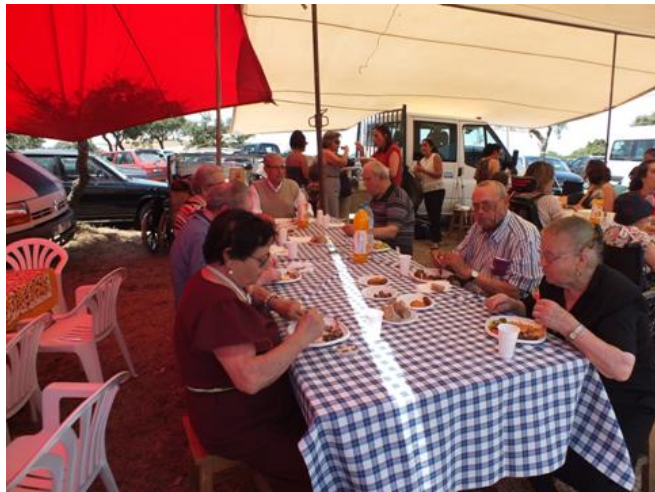
Festa da N a Sra. da Ortiga 05-07-2016