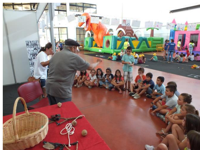
Dia dos Avós – Convívio intergeracional CLDS Ourém 26-07-2016