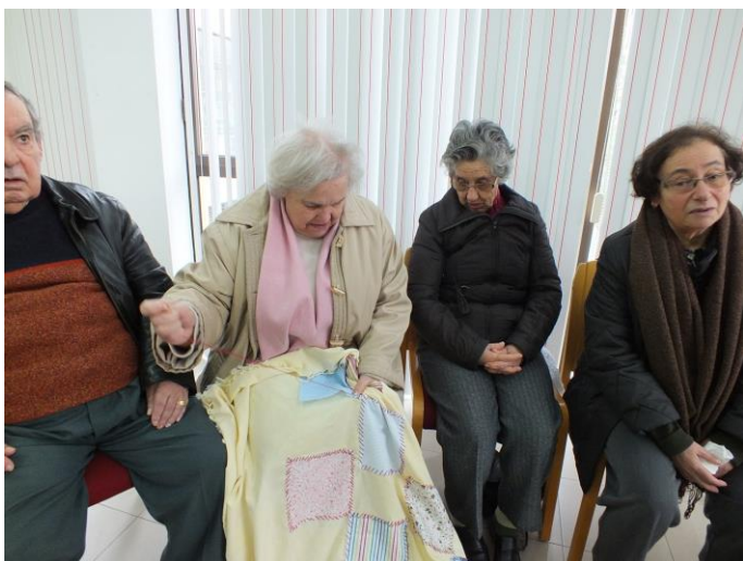
Afectos e uma manta Projeto Biblioteca Municipal de Ourém 24-02-2016