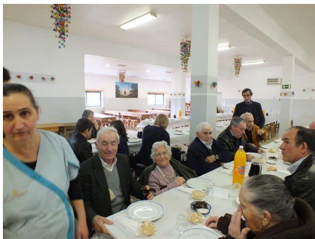
Almoço das comadres 07-02-2016