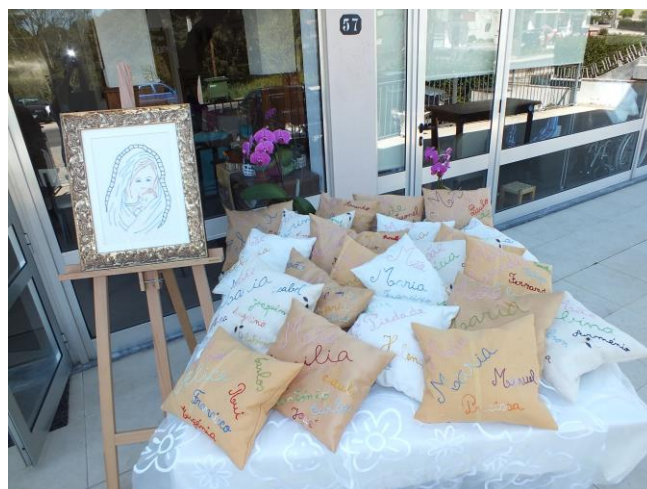
Dia da Mãe 30-04-2016