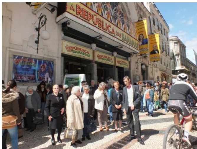
Passeio Sénior 01-04-2016