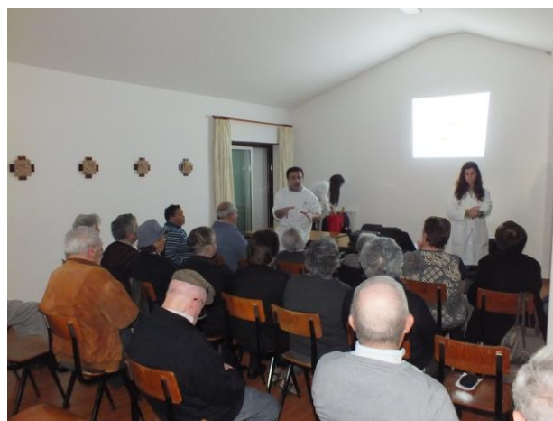
Rastreio de pele pelo Hosp. Santarém 23-05-2016