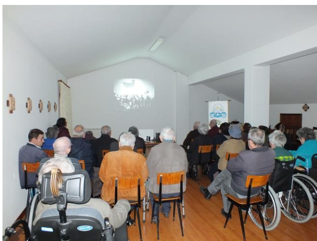
Sessão de cinema 23-02-2016