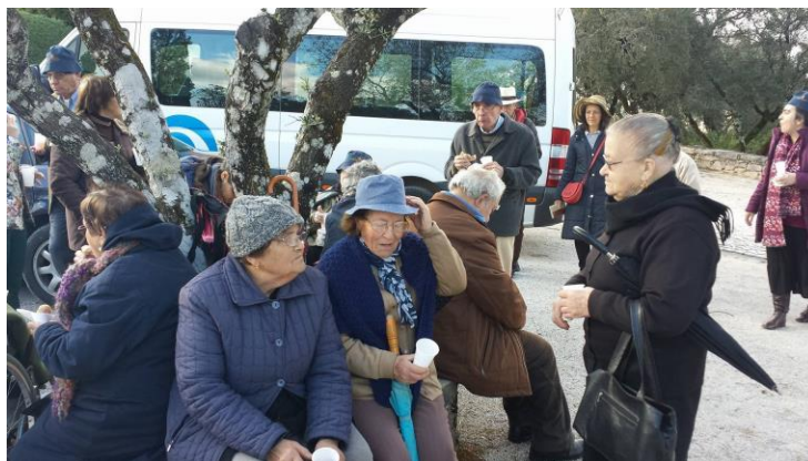
Via Sacra nos Valinhos 22-03-2016