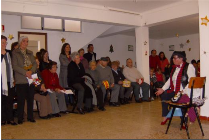
4 Dezembro – Festa de Natal na Instituição