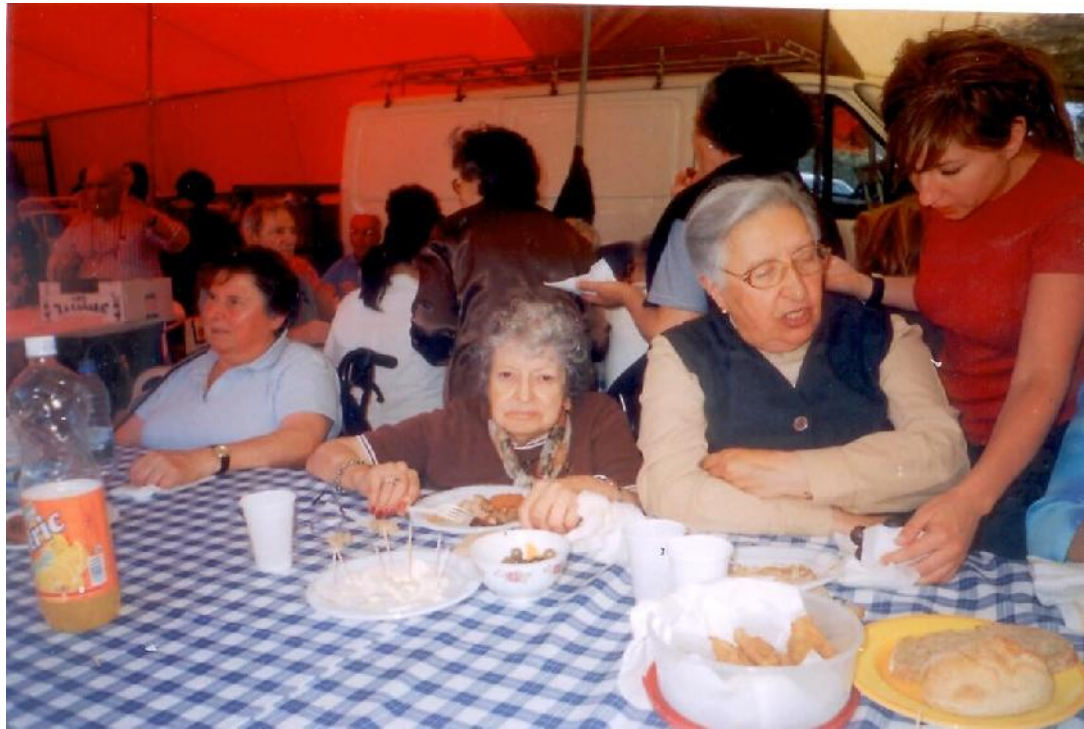
5 Julho – Festa Nª Sra. Da Ortiga