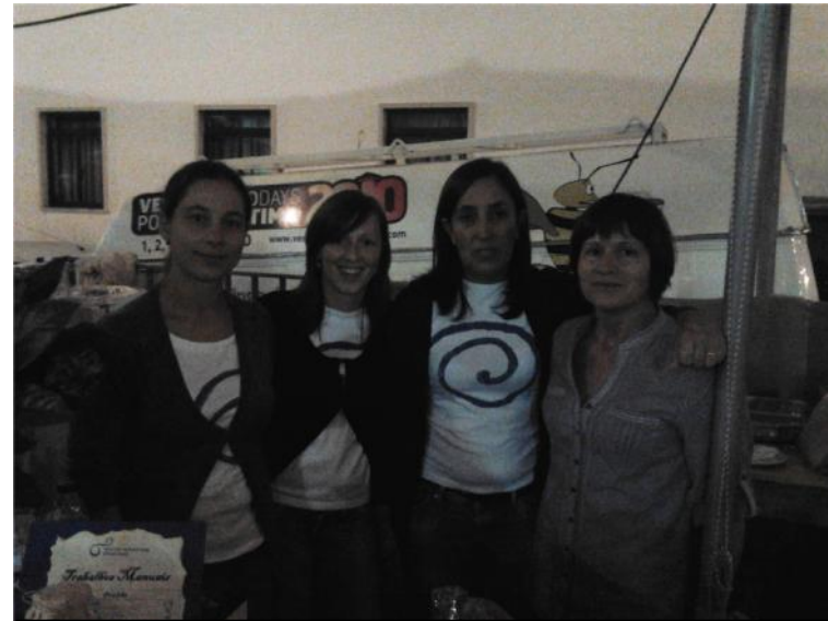
10 Setembro – Participação na Concentração de Vespas de Fátima