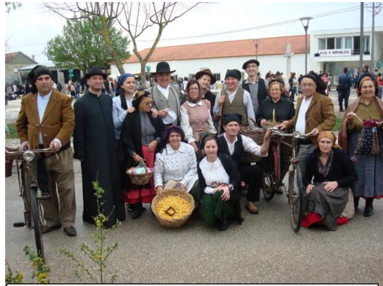
2 Abril – Feira do Centenário da República