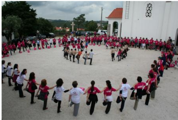
1 Maio – Caminhada pela Solidariedade