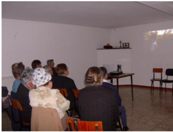
7 Junho – Filme “As aparições de Fátima”