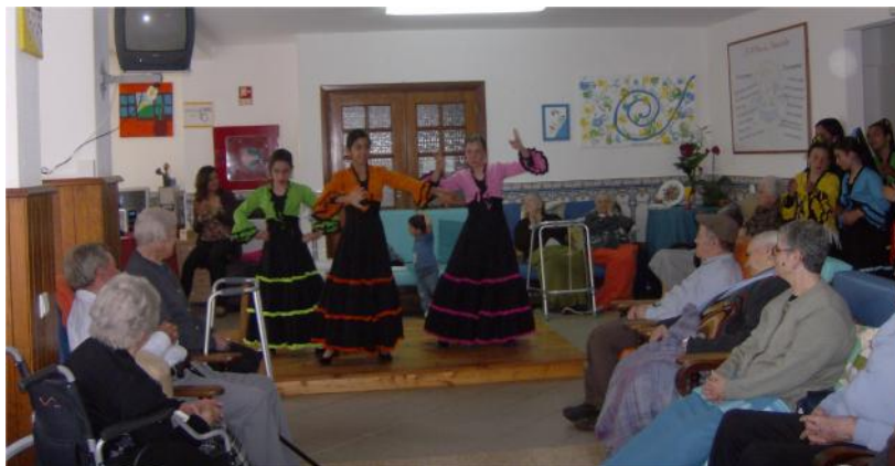
5 Maio – Comemoração do Dia Mundial da Dança