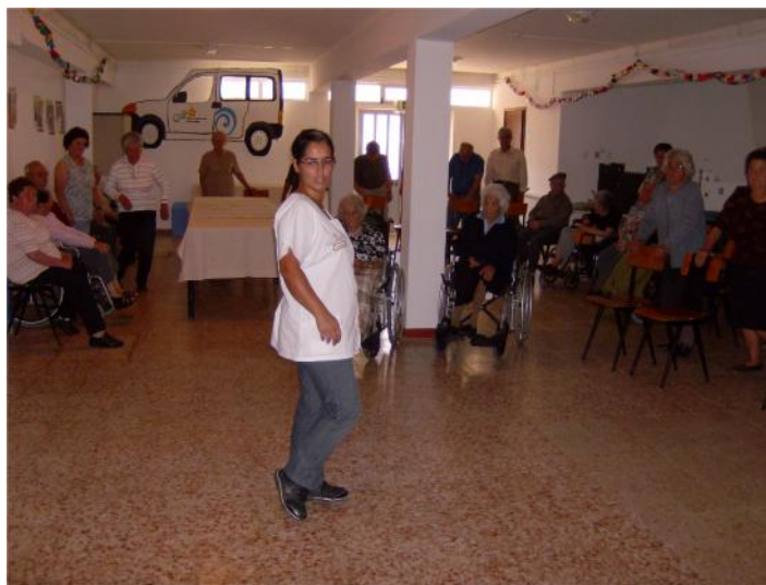
21 Setembro – Comemoração do Dia Mundial do Doente de Alzheimer