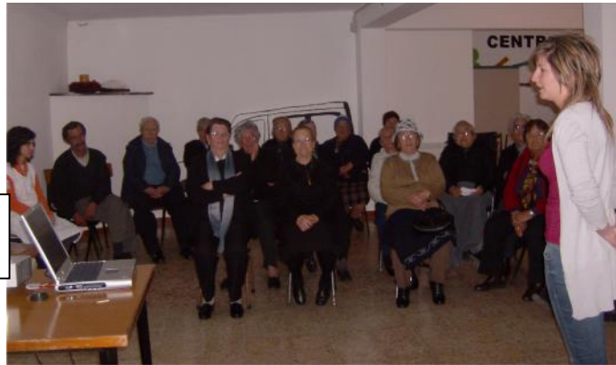
22 Março – Ação de sensibilização “Segurança Rodoviária”