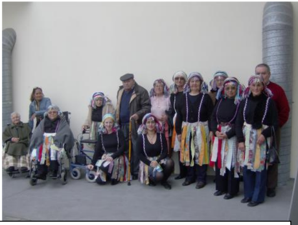
4 de Março - Baile Carnaval - Matiné na Kayenne