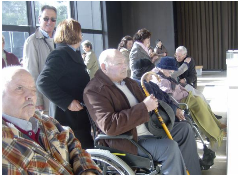
11 de Fevereiro - Participação nas comemorações do Dia Mundial do Doente - Santuário de Fátima