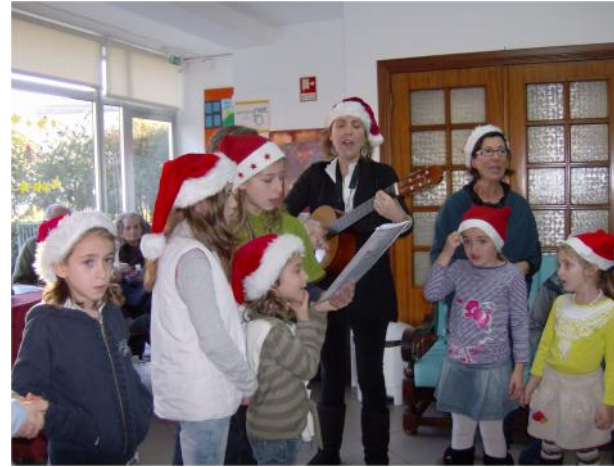
24 Dezembro – Visita de crianças “Pai Natal”, aos clientes de ERI