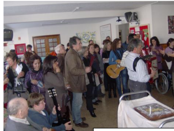
19 de Março - Dia do Pai