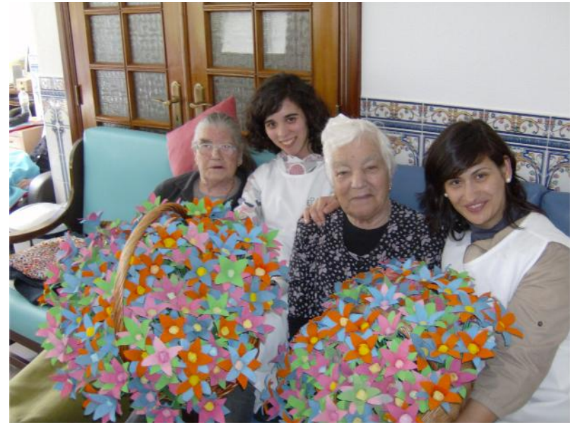
Fevereiro – Preparação de flores de papel para o Dia da Mulher