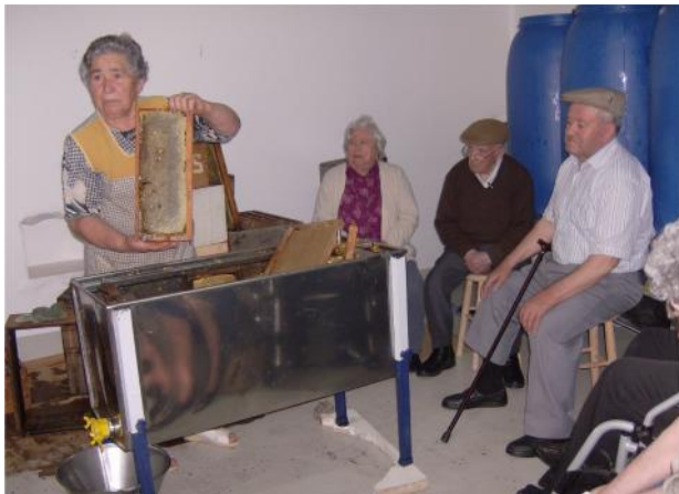
26 Maio – Visita o mel