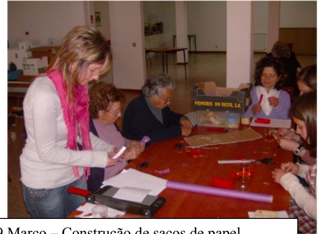
29 Março – Construção de sacos de papel