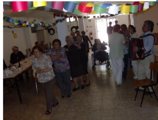
14 Junho – Festa dos Santos Populares