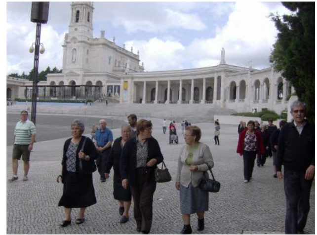
17 Maio – Visita à exposição “Fátima e Luz”