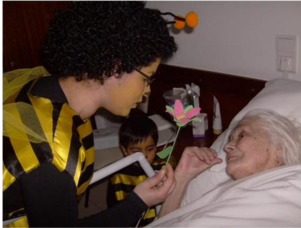
7 de Março - Carnaval e Dia da Mulher