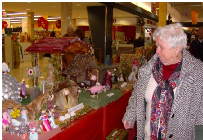
14 Dezembro – Visita aos enfeites de Natal do Município de Ourém