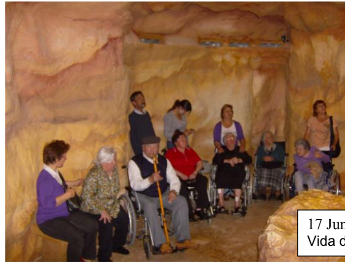
17 Junho – Visita ao Museu da Vida de Cristo