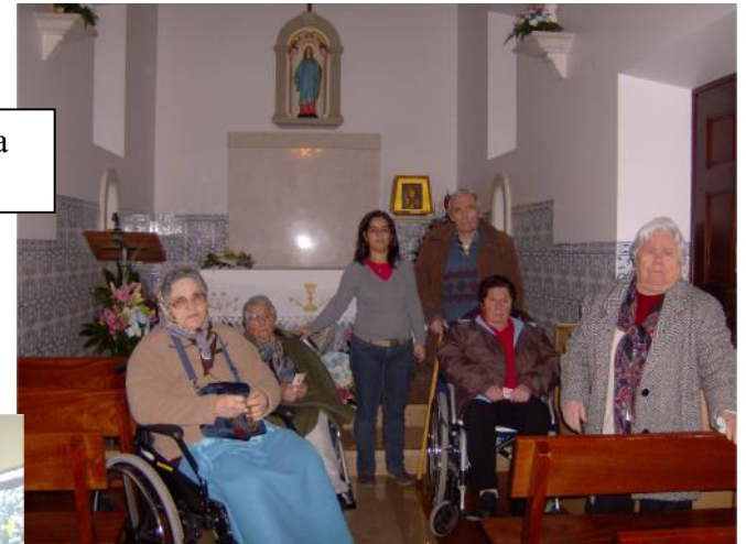
14 Dezembro – Visita à Capela de Sta. Luzia