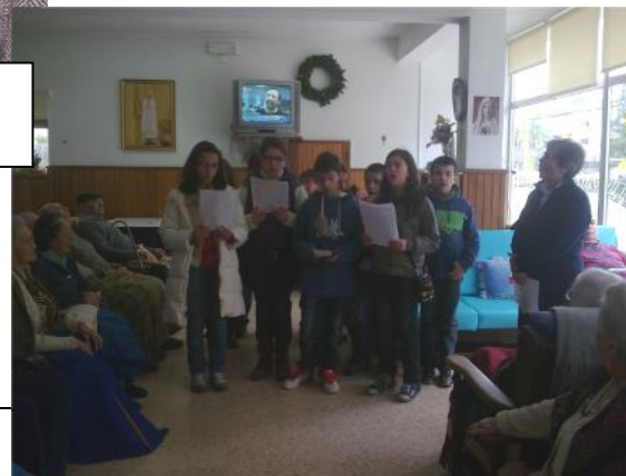
15 Dezembro – Visita dos alunos do Colégio Sagrado Coração de Maria