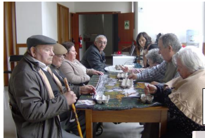
18 Maio – Dia Internacional dos Museus – ida ao Museu de Arte Sacra