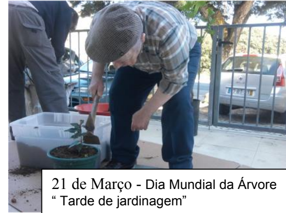
21 de Março - Dia Mundial da Árvore " Tarde de jardinagem"