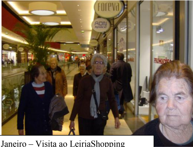
25 e 26 Janeiro – Visita ao LeiriaShopping