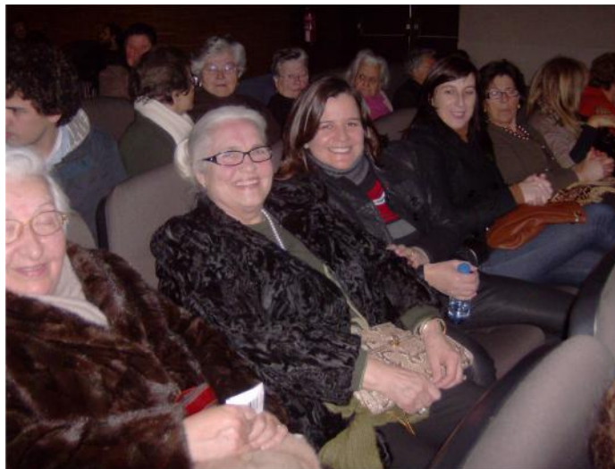
3 Fevereiro – Ida ao teatro