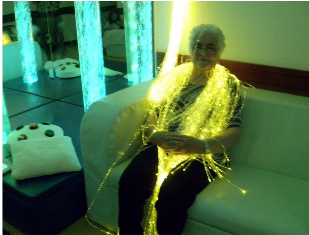
10 e 12 Agosto – Sessão Snoezelen