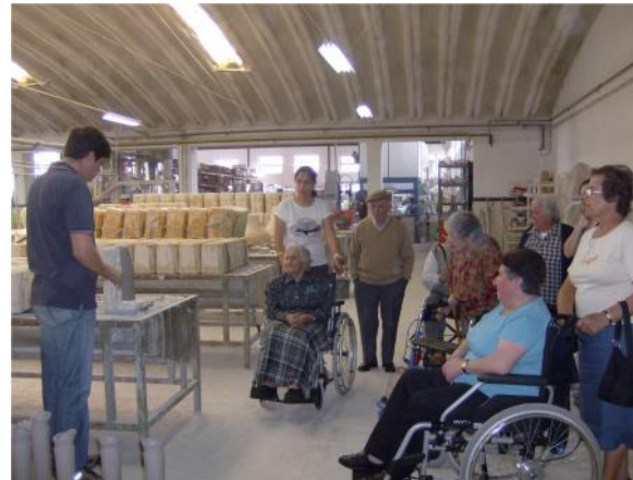
27 Maio – Visita a Fábrica de louças