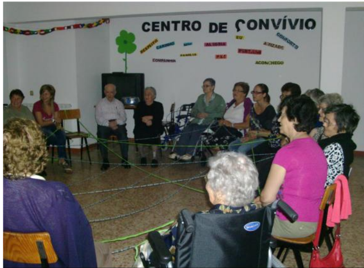
23 Setembro – Visita de alguns clientes da Casa do Povo de Fanhais da Luz, Açores