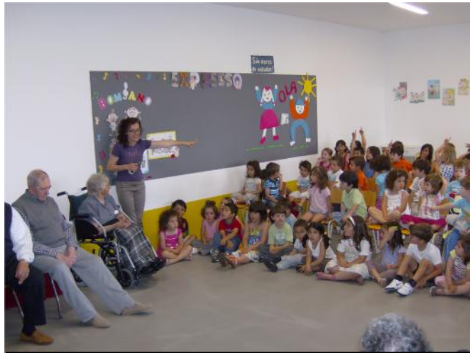
1 Junho – Dia da Criança