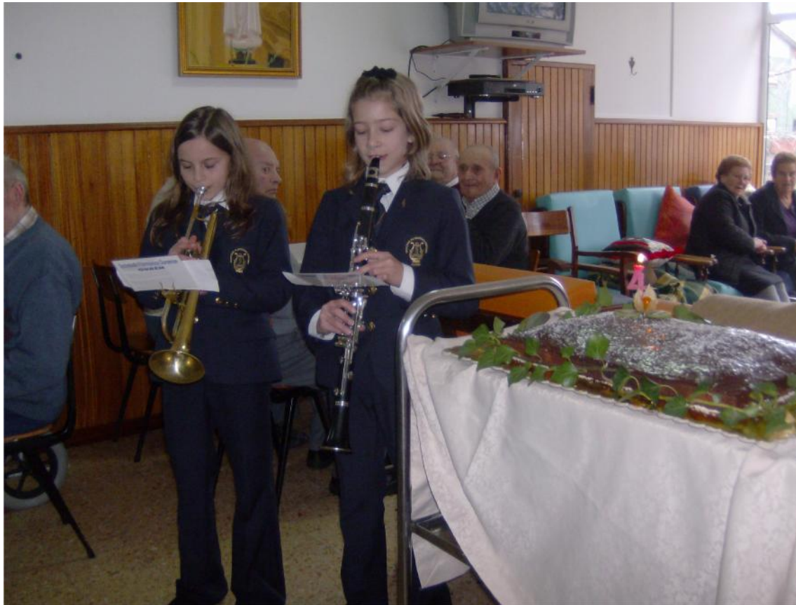
15 de Janeiro - Comemoração do IVº Aniversário de abertura do Lar de Idosos