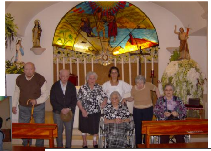
24 Junho – Visita à capela de S. João