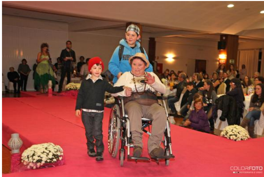
28 Outubro – VI Aniversário da Santa Casa