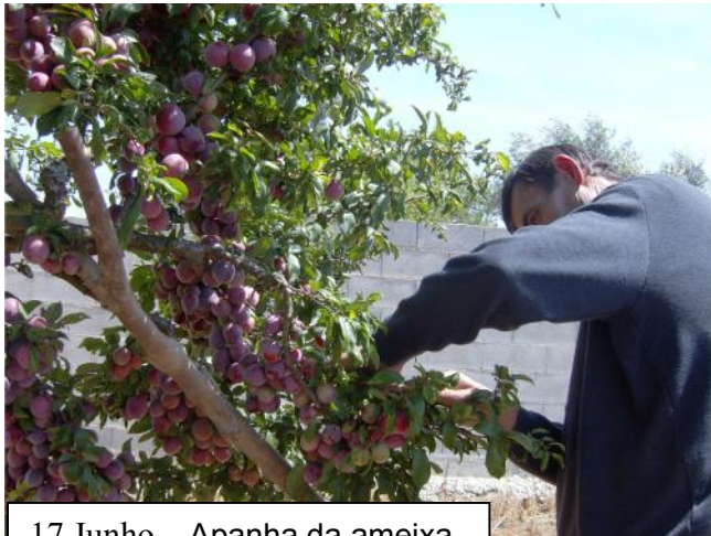
17 Junho – Apanha da ameixa