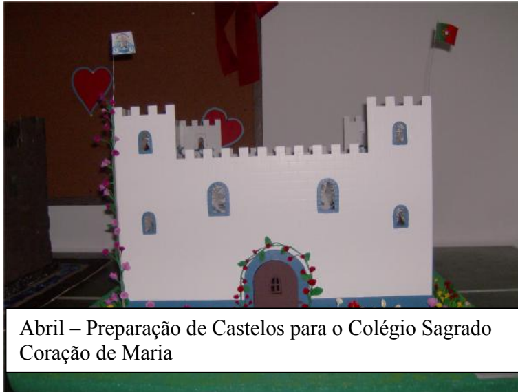
Abril – Preparação de Castelos para o Colégio Sagrado Coração de Maria