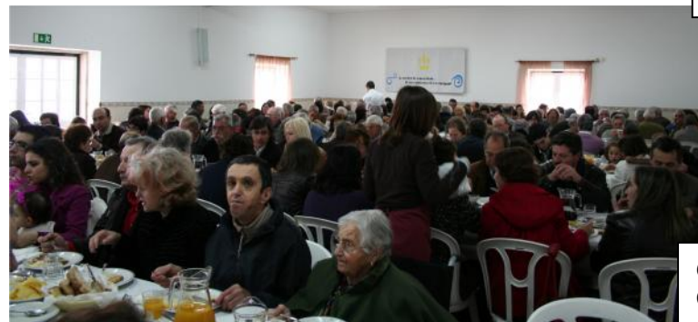
6 de Março – Festa das Comadres